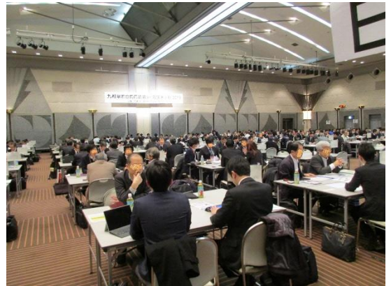
平成30年度に実施した「九都県市合同商談会2019」の商談風景 (会場:幕張メッセ コンベンションホール)

是非、この機会に発注企業としてご参加いただき、協力企業・外注企業の新規開拓や将来の発注に向けた情報収集等の場としてご活用ください。