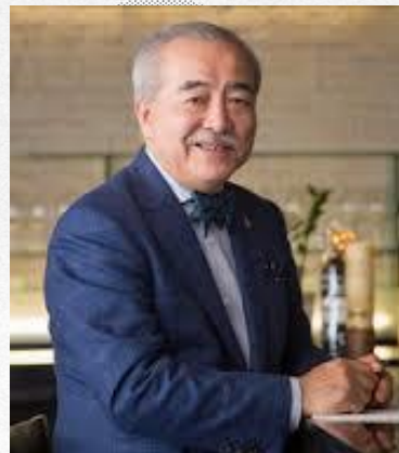
影響力あるキャスト