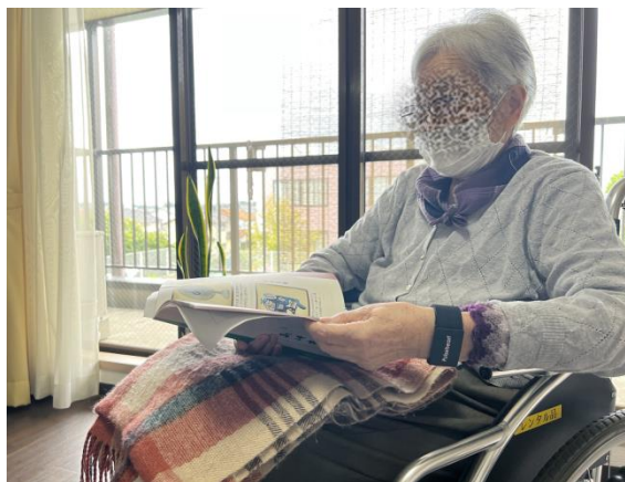
入居者様装着 ↑ ↓