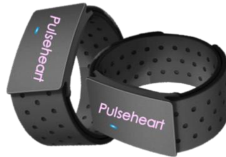
パルスハートバンド ナースセンター ↓