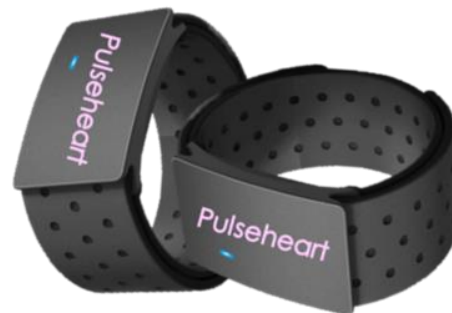
パルスハートバンド ナースセンター ↓