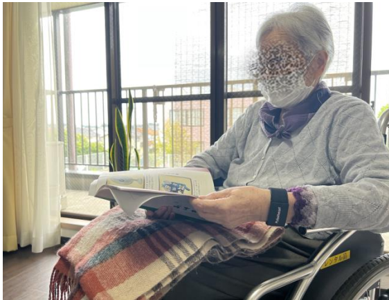
入居者様装着 ↑ ↓