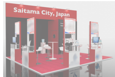
※ブースイメージ（仮）