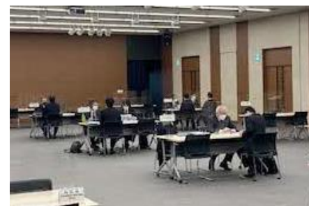
令和2年度商談会の様子。 マスク着用およびアクリル板の設置、ソーシャルディスタンスの確保等、十分な感染症対策を講じつつ、開催しました。